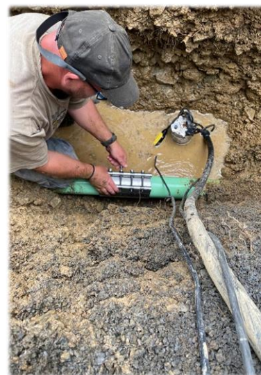
Oprava poruchy na vodovodním řádu (tímto se omlouváme za zhoršení kvality a dostupnosti pitné vody v období 16-18. srpna)