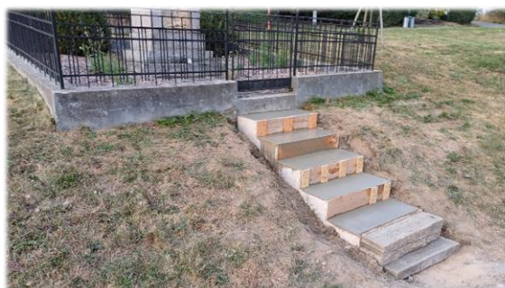
Kompletně nová výstavba schodiště u pomníku padlých