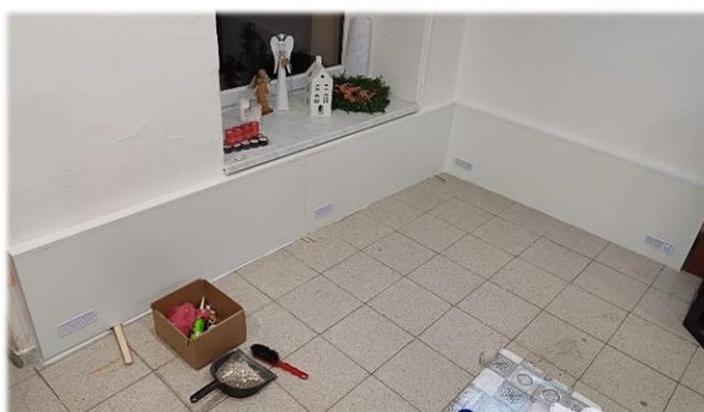
Výmalba a oprava (odvětrávání) obvodových stěn v obecním obchodě