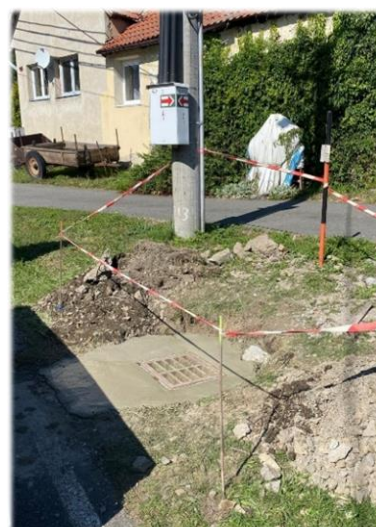
Kompletní renovace zborcené šachty dešťové kanalizace