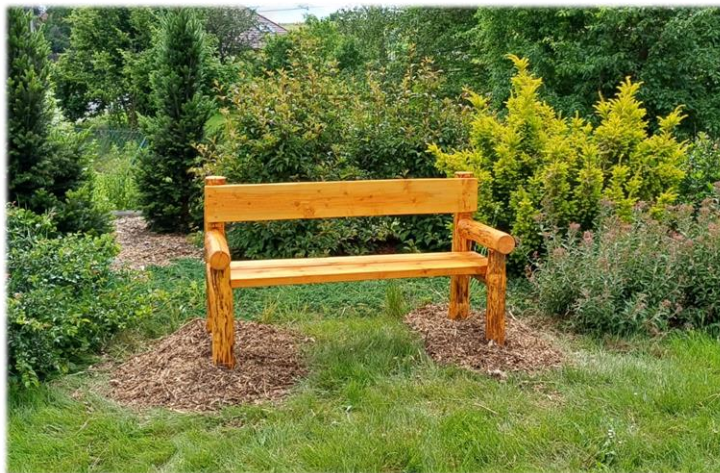
Nové lavičky v parčíku u kapličky a dole u Šlosarového