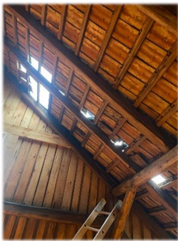
Oprava tašek na obecní stodole

V průběhu roku provádíme drobné opravy po celé obci na všech potřebných místech.